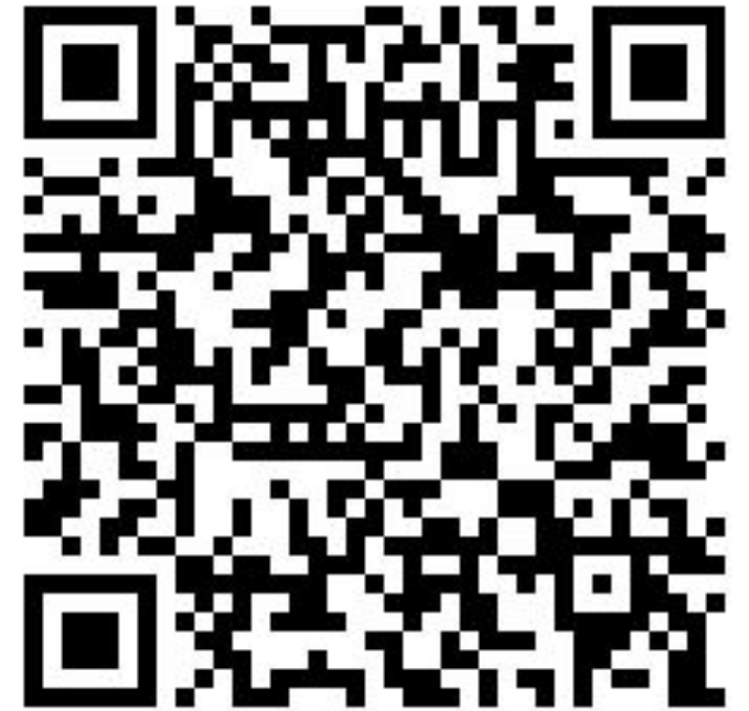
Universidad del Valle