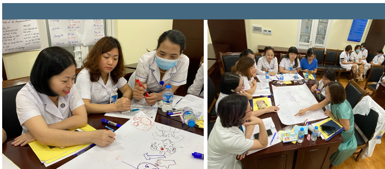
Sử dụng công cụ trực quan sinh động để mô tả vấn đề trong tập huấn. Tập huấn cho tập huấn viên tại Hà Nội.